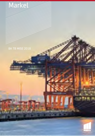
BA TB MISE 2018