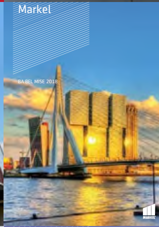
BA BEL MISE 2018