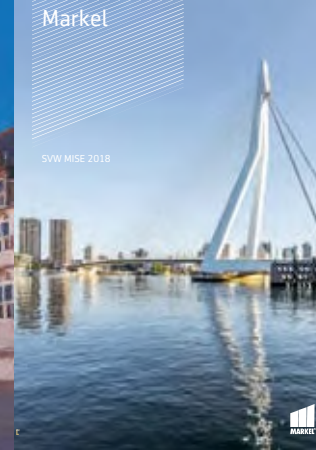
SVW MISE 2018