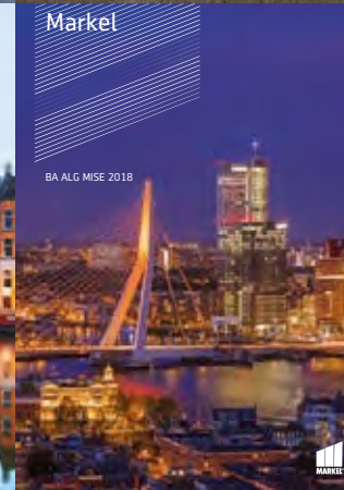
BA ALG MISE 2018