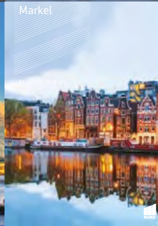
BA BRU MISE 2018