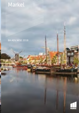
BA ADV MISE 2018