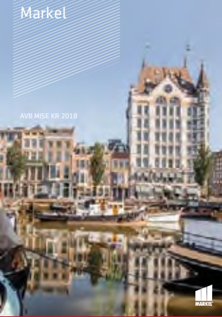
AVB MISE KR 2018