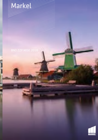
BND ZYP MISE 2018