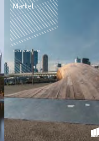
BND ALG MISE 2018