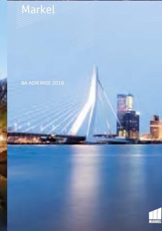
BA ADM MISE 2018