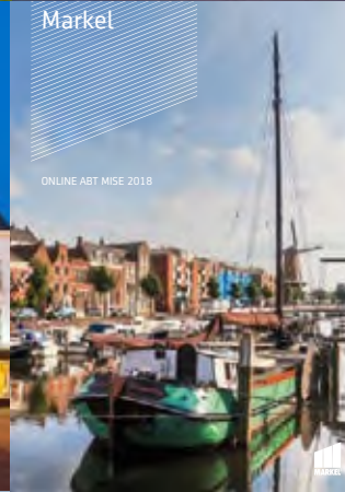
ONLINE ABT MISE 2018