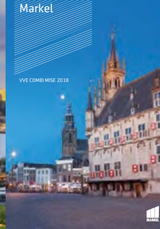
VVE COMBI MISE 2018