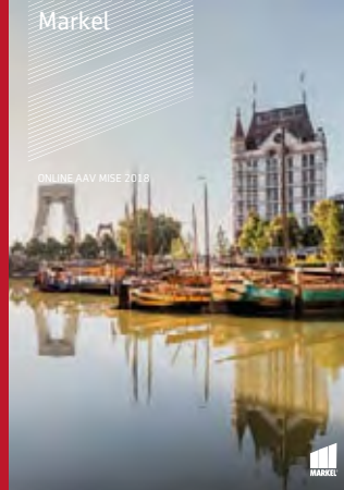
ONLINE AAV MISE 2018