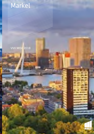
VVV MISE 2018