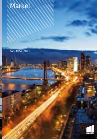
AVB MISE 2018