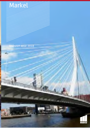
BND ZYP MISE 2018