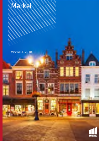
VVV MISE 2018