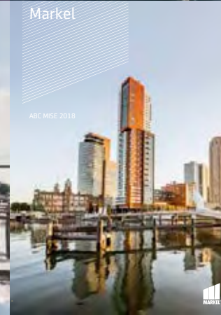
ABC MISE 2018