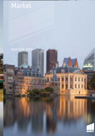
B&W MISE 2018