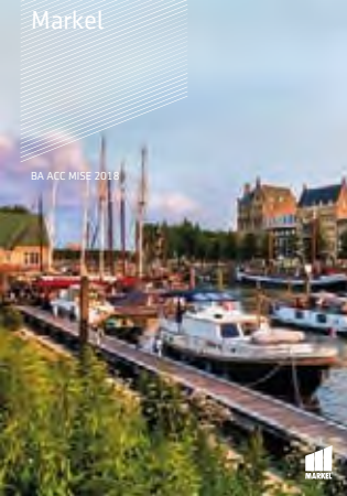
BA ACC MISE 2018